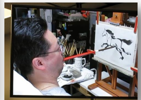
作品制作の様子(ビデオ)