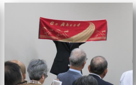
牧野氏の作品紹介